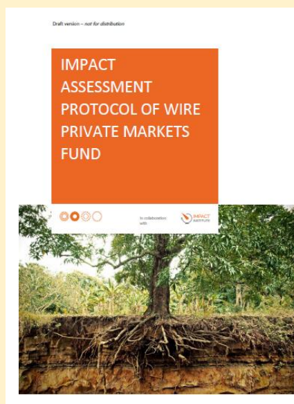
Screenshot Impact Assessment Protocol